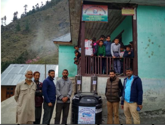
राजकीय माध्यमिक विद्यालय पिंजराड़ी ,ग्राम सौन्दर