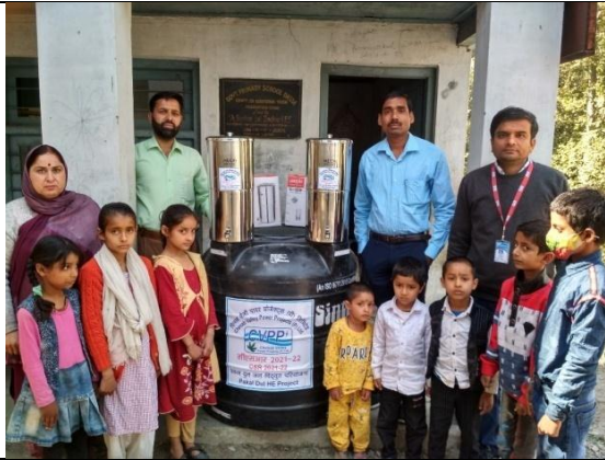
राजकीय प्राथमिक विद्यालय दासा, ग्राम दूल