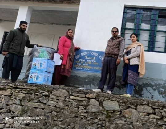
राजकीय माध्यमिक विद्यालय किरू, ग्राम गलहार