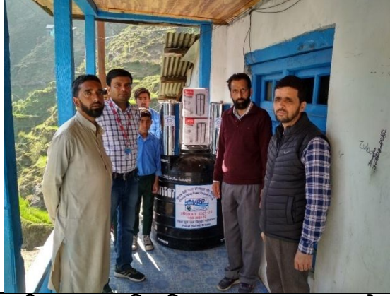
राजकीय अपर प्राथमिकविद्यालय क्राइपखनू, ग्राम लोपारा