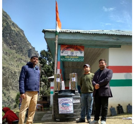
राजकीय माध्यमिक विद्यालय इखाला, ग्राम सौन्दर