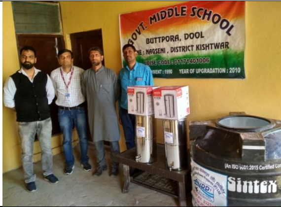
राजकीय माध्यमिक विद्यालय बटपुरा, ग्राम दूल