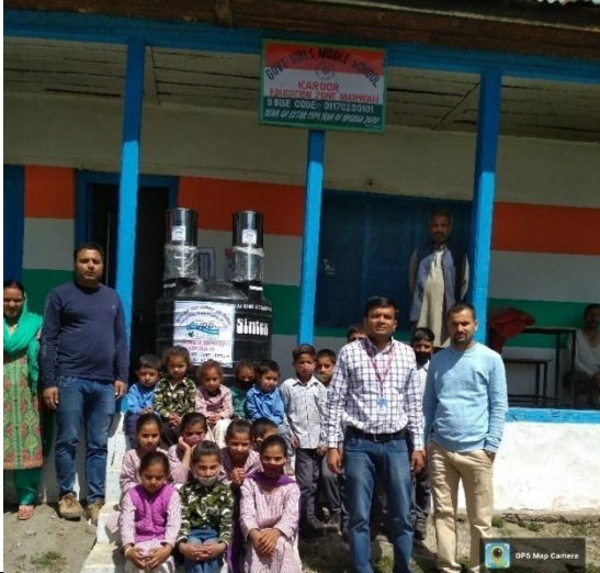
राजकीय बालिका माध्यमिक विद्यालय करूर, ग्राम सौन्दर