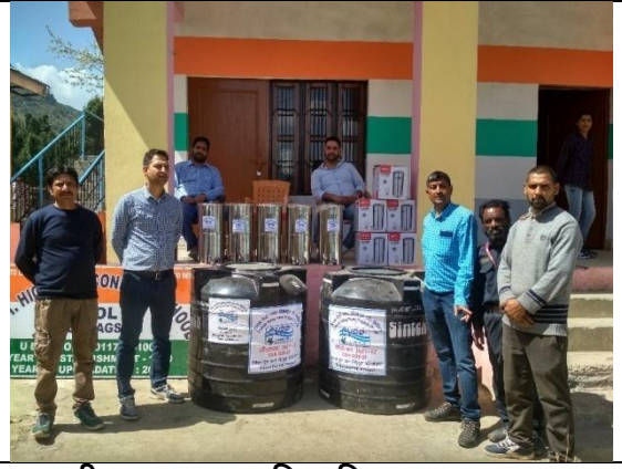
राजकीय उच्चतर माध्यमिक विद्यालय दूल, ग्राम दूल