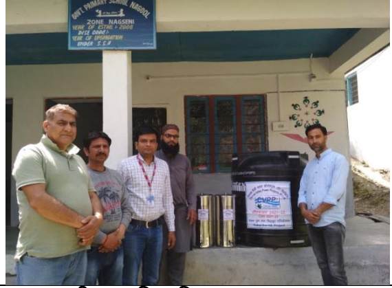
राजकीय प्राथमिक विद्यालय नगूल, ग्राम दूल