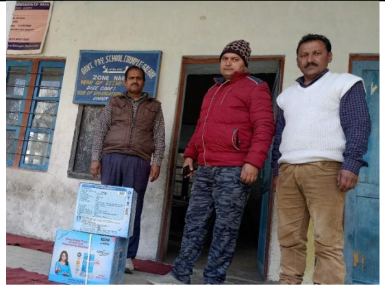
राजकीय प्राथमिक विद्यालय चांपली, ग्राम गलहार