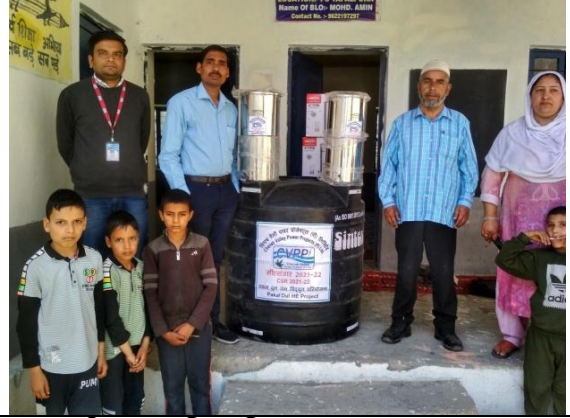
राजकीय माध्यमिक विद्यालय टपलपुरा, ग्राम दूल