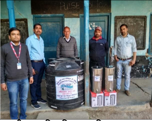
राजकीय माध्यमिक विद्यालय मलिकपुरा, ग्राम दूल